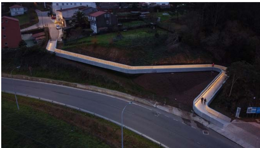
Nova rampla ao final da baixada do Monte do Gozo

Xa na zona do Tanguero, alargáronse os pasos do Camiño sobre a AP-9 e o ferrocarril. Repuxéronse as prazas de aparcadoiro na marxe dereita e, ademais, aproveitouse o paso do Camiño para mellorar o espazo fronte ao núcleo de casas anterior á SC-20, co que se acadou un paso máis directo dos peregrinos pola rotonda.