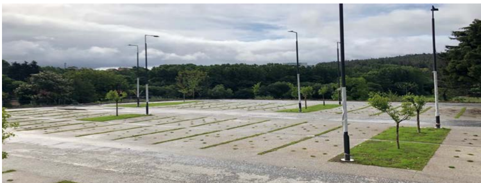
Novo aparcadoiro de Conxo

En canto ao Camiño Francés, a intervención comezou no Monte de Gozo, onde se creou unha praza fronte á capela e executouse unha senda de baixada para o peregrino que parte do adro da capela de San Marcos, atravesa a carballeira e continúa a través dunha parcela separada da calzada. O tramo final da baixada desde o Monte do Gozo resolveuse mediante unha pasarela elevada de percorrido accesible que conectou este punto da rúa do Gozo coa N-634 e o seu paso sobre a AP-9, co que se eliminaron as escaleiras.