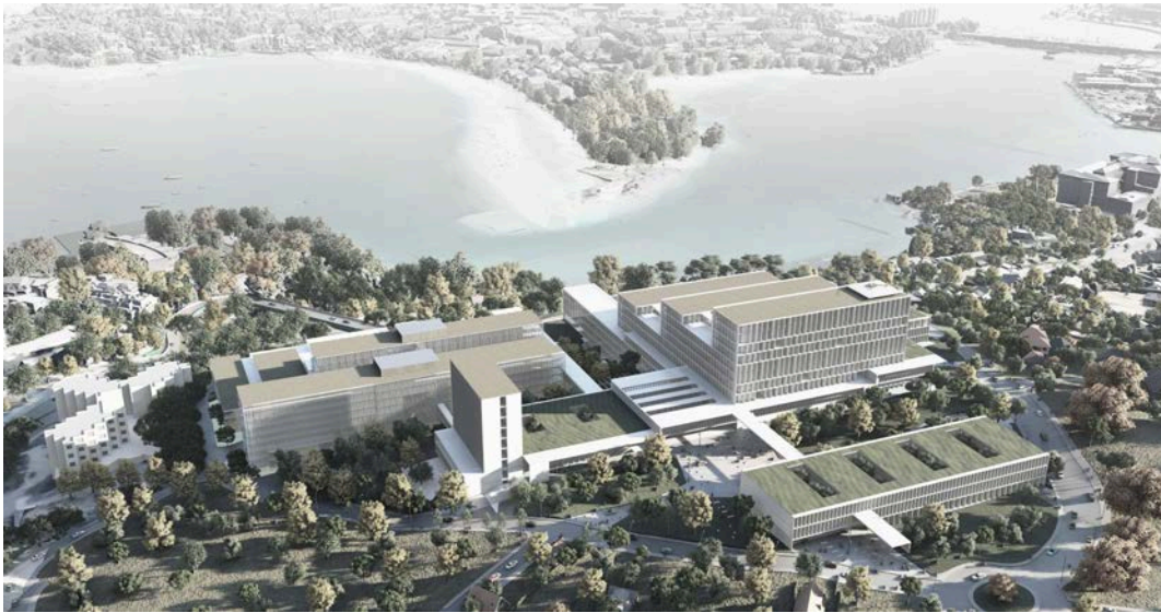
Imaxes do novo CHUAC

creación dunha nova planta de hospitalización; e a ampliación os servizos de urxencia e o número de camas para coidados intensivos.