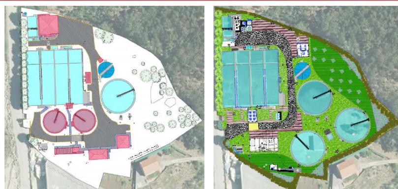
Configuración de EDAR existente

Imaxe da configuración da depuradora existente e da configuración proxectada: